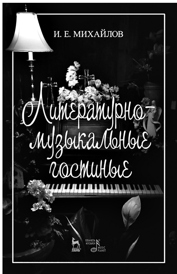
Обложка учебно-методического пособия, вышедшего в 2020 году. Автор: И. Е. Михайлов

Действительно, на первый взгляд, какое отношение имеет естественнонаучное или техническое знание к искусству? Имеет, и большое, если мыслить об этом в рамках общеобразовательной концепции просвещения, воспитания и развития маленького музыканта, — будущего профессионала. У таких детей, нацеленных в дальнейшем на