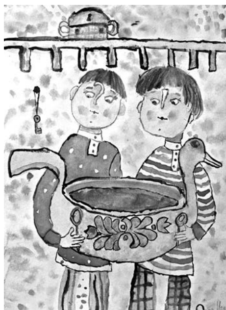
Олег Б. Два молодца

Вот пример свободной импровизации, прочтение юным художником песни «Дубинушка». Для того, чтобы создать такой образ «Лесоруба», ребенок, несомненно, слушал песню «Дубинушка» в испол-