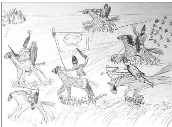
Рисунок слева: Онфим (6 лет), XII в., Великий Новгород.