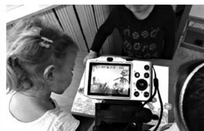
Рабочие моменты съемки и озвучивания мультфильма