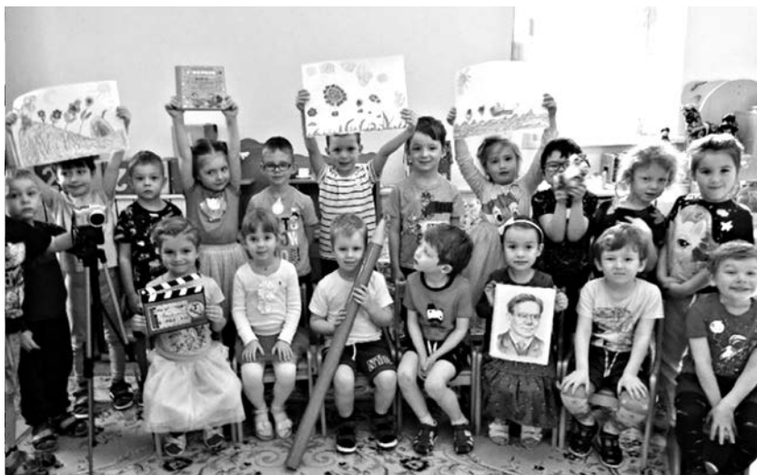
Мультипликационная студия «Веселый карандаш». Юные мультипликаторы

реалистично, как в природе, или «очеловечивают» героев, облачая их в различные одежды.