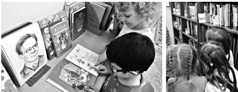
Экскурсия в детскую библиотеку

Театрализованная деятельность и игры непосредственно связаны с музыкой. Это и прослушивание различных фонограмм, пение и ритмические движения под музыку, драматизация и танец, художественное слово и ритмичное хлопанье. В играх-импровизациях дошкольники пластикой собственного тела показывают характер музыки.