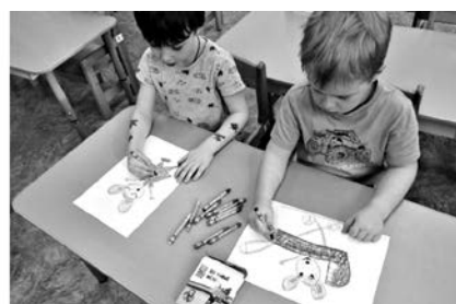
Юные художники создают декорацию и рисуют сказочных героев