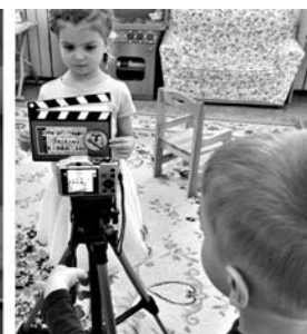
Дети 4–5 лет — непосредственные участники съемки различных сцен мультфильма