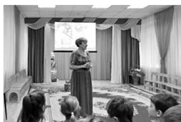
Премьера мультфильма: беседа со зрителями