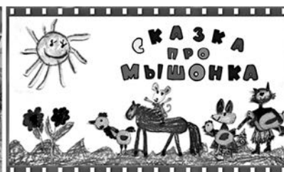
Вырезаем нарисованных героев для съемки мультфильма. Первый кадр мультфильма