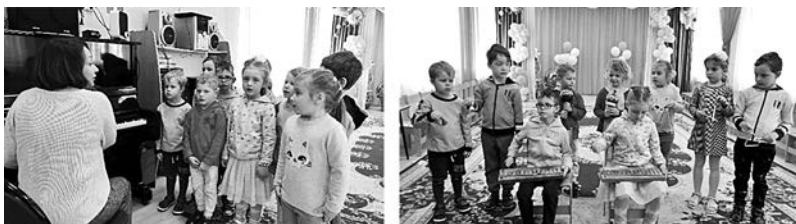
Пение любимой песенки о цыплятах. Волебно звучащие музыкальные инструменты