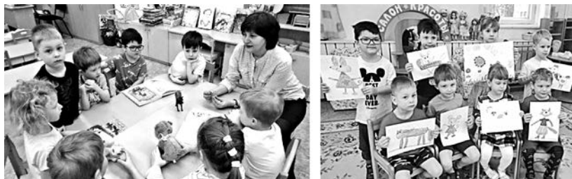
Обсуждение сценария мультфильма. Рисунки сказочных героев

Обратившись к иллюстрациям ранних изданий книг С. Маршак «Сказка о глупом мышонке» (художники: В. Лебедев, В. Конашевич, А. Елисеев), мы сосредоточили внимание детей на том, что иллюстраторы по-разному изображают животных: