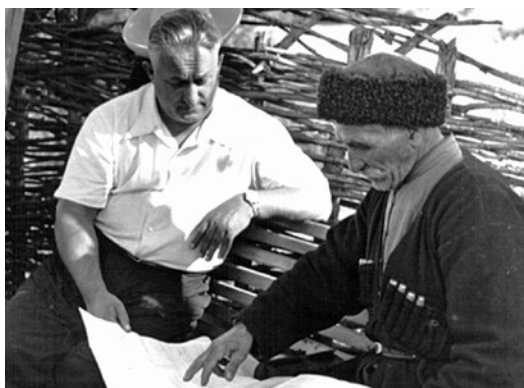
Вано Мурадели (слева) в Грузии

В 1895 году в журнале «Артист» была опубликована статья Ипполитова-Иванова «Грузинская народная песня и ее современное состояние», которая была тесно связана со сложившимися в России традициями научного изучения отечественного казачества конца XIX века. Многочисленные отклики, которые появились сразу после выхода статьи Ипполитова-Иванова, свидетельствуют о том, что композитором были затронуты именно те вопросы, которые волновали представителей искусства Грузии. М. Баланчивадзе охарактеризовал статью Ипполитова-Иванова так: «Дать правильную характеристику грузинской народной песне и первый шаг на неведомой почте, должен представлять большую трудность». Создавая свою работу, Ипполитов-Иванов ориентировался на сложившиеся традиции в отечественной музыкальной фольклористике. Однако, большинство материала составлялось слуховыми расшифровками грузинских песен, которые осуществлялись самим Ипполитовым-Ивановым. Записи велись в г. Телави, в Мингрелии, Гурии, Цинандали, Мухрани, в Арагвском ущелье. Ипполитов-Иванов исходил от верной установки для конца XIX столетия о безусловном влиянии общеисторических событий, этнографических и лингвистических особенностей местной традиции и исполнительской стилистики народной песни.