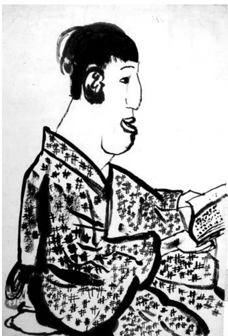
Рис. 10. Н. а. 13 лет. Япония. Портрет мужчины в кимоно с книгой в руках. 1920-е гг.

на рисовой бумаге акварельными красками пейзаж, изображающий сад камней, и два портрета в традиционной для Японии технике тушью, пером и кистью. (9—11). Всего три произведения, но в них выражены и особенности культуры страны, и национальный язык изобразительного искусства. Впервые эти работы были показаны на выставке осенью 1927 года. Международное сотрудничество Японии и СССР в области «художественных наук» было направлено на изучение природы искусства, художественно-образного мышления человека в процессе взросления. Коллекция детского рисунка Государственной академии художественных наук, переданная в 1931 году в Центральный дом художественного воспитания детей имени А. С. Бубнова Наркомпроса РСФСР, насчитывала 60 тысяч единиц хранения.