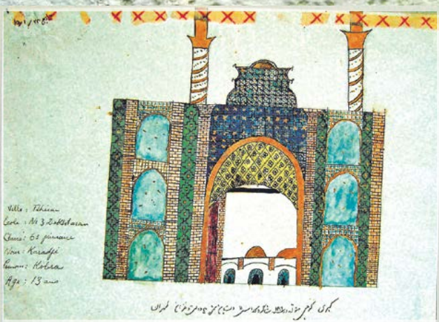
Рис. 13. Кобра Карадии, 13 лет. Иран, г. Тегеран. Фасад медресе. 1930-е гг.