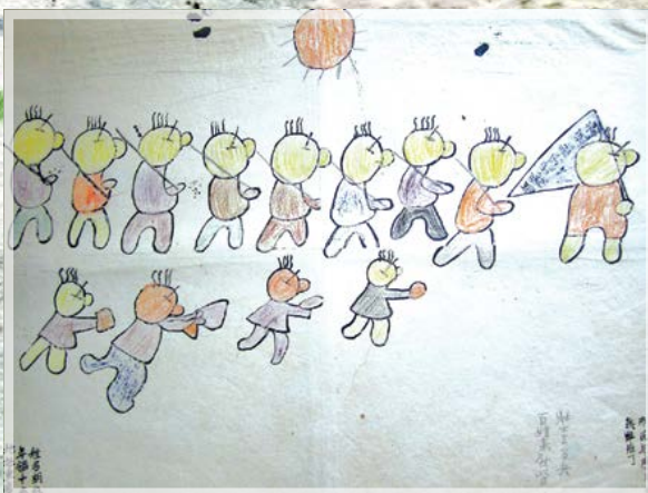
Рис. 24. Н. а. Китай. Мужчины идут в солдаты. Население провожает их. 1940 г.