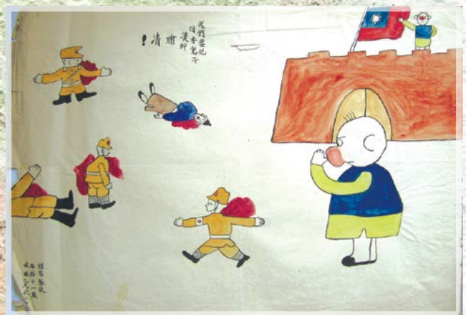
Рис. 25. Н. а. Китай. Мы должны очистить страну от японцев и предателей! 1940 г.