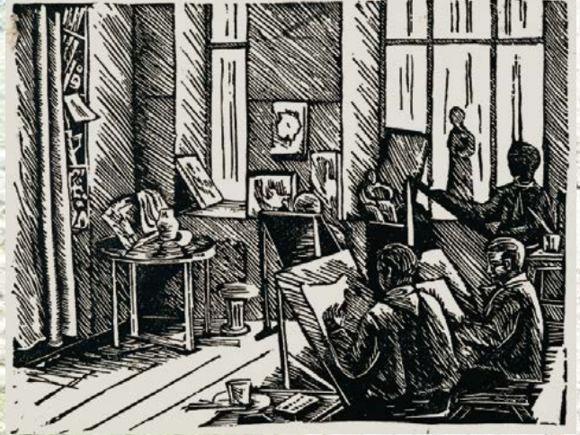
Рисунок на афише: Нина Минакова, 15 лет, «Занятия в изостудии», 1920-е гг.