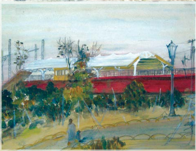
Рис. 11. Н. а. 13 лет. Япония. Сад. 1920-е гг.