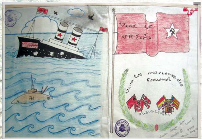
Рис. 22. Висента Сайас Солер, 14 лет. Испания, Валенсия. Институт «Бласко Ибаньес». Да здравствует команда «Комсомола». 1937 г.