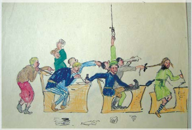
Рис. 4. Фаворский Никита, 11 лет. Карикатура: школьники в классе. 1926 г.