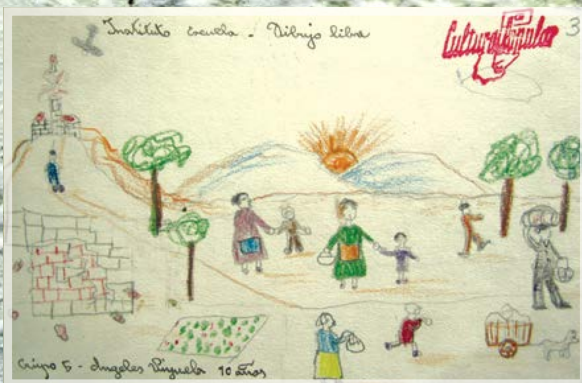
Рис. 20. Анхелес Вийуэла, 10 лет. Испания, Валенсия. Институт-школа. Вдали бомбят. 1937 г.