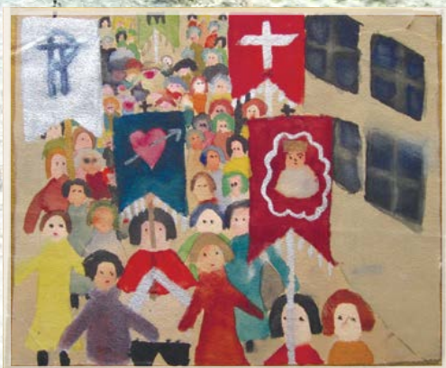
Рис. 26. Каль (?) Мария, 10 лет. Польша. Варшава. Религиозная процессия. 1934 г.