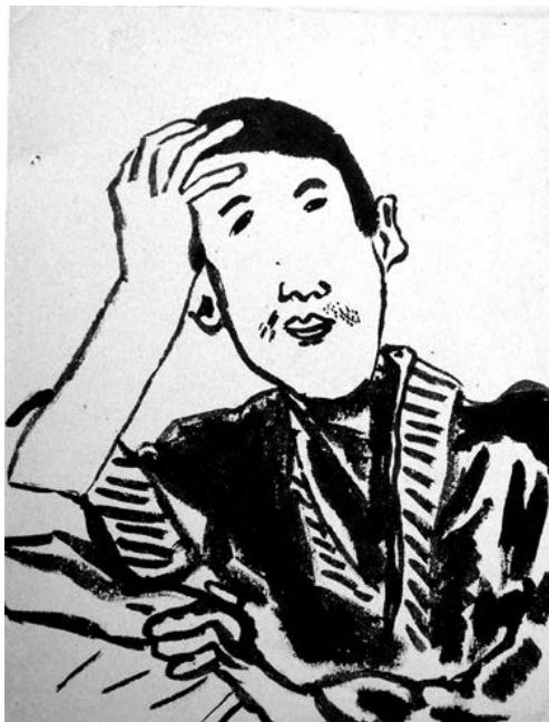
Рис. 9. Н. а. 13 лет. Япония. Портрет юноши. 1920-е гг.

Каждая выставка детского рисунка, организуемая Институтом, имеет свою идею. На данной выставке мы стремились показать начальные периоды становления коллекции. Самым значительным для истории педагогики искусства является этап формирования коллекции А. В. Бакушинским в Государственной академии художественных наук в 1921—1929. На выставке были представлены три работы японских детей, поступившие в коллекцию на этапе ее формирования в 1920-е годы. Это выполненный