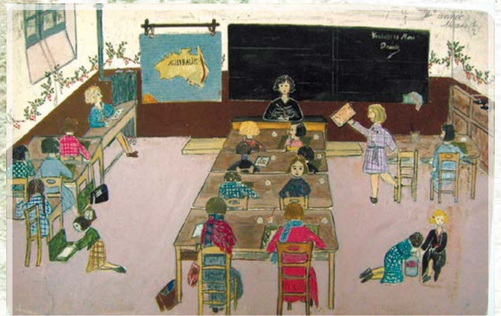
Рис. 14. Варанья, 14 лет, Франция, г. Париж. В классе. На уроке рисования. 1934 г.