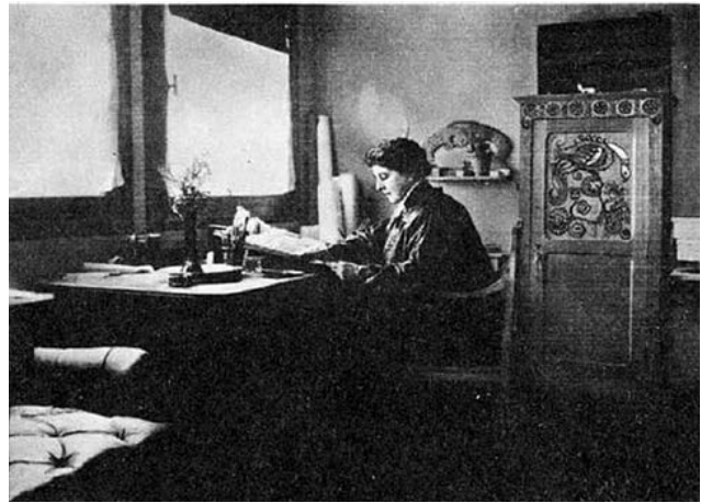
М. К. Тенишева в своей эмалевой мастерской в Малом Талашкине под Парижем

Звуки могут быть плотными, тяжелыми, а могут быть прозрачными. Но если вместо слова «звук» поставить слово эмаль, то это будут уже характеристики художественной эмали. Эмали бывают про-