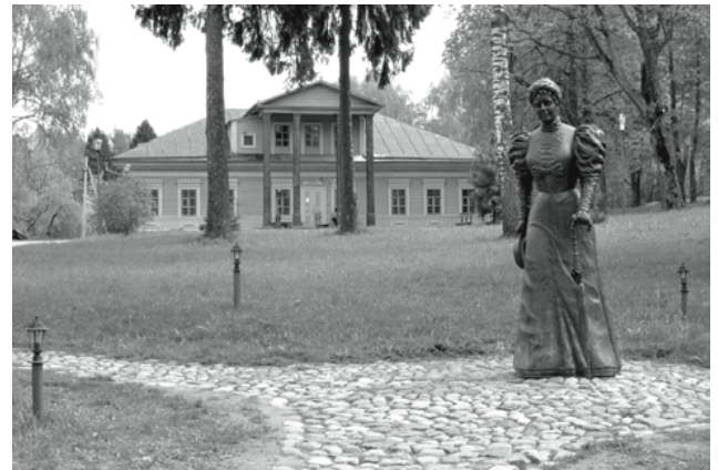
Памятник М. К. Тенишевой в Талашкино. 2008 г. Скульптор Л. Ельчанинова

Бесспорно, семейный дуэт, начинавшийся как музыкальный, вписал в историю культуры России много важных страниц. Мы остановились очень кратко и фрагментарно только на одной грани таланта этой удивительной пары — князя Вячеслава Нико-