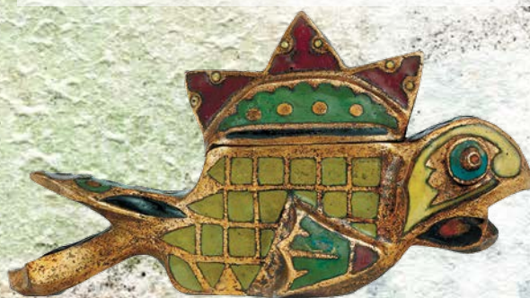
Тенишева М. К. Шкатулка «Рыба». 1908. Бронза, эмаль