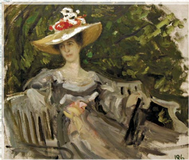
Коровин К. А. Портрет М. К. Тенишевой. 1899. Холст, масло. Смоленский государственный музей-заповедник