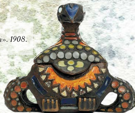
Тенишева М. К. Шкатулка «Утка». 1908. Бронза, эмаль