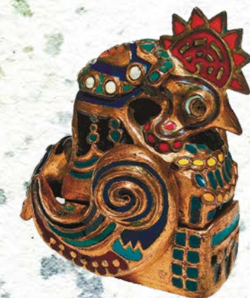
Тенишева М. К. Шкатулка «Петух». 1908. Вылита из бронзы, украшена 12 оттенками эмали, инкрустирована жемчугом