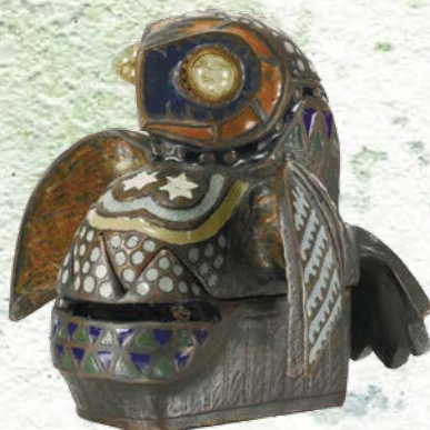
Тенишева М. К. Шкатулка «Сова». 1908. Бронза, эмаль