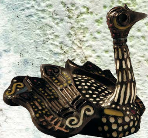
Тенишева М. К. Шкатулка «Лебедь». 1908. Бронза, эмаль, техника папье-маше