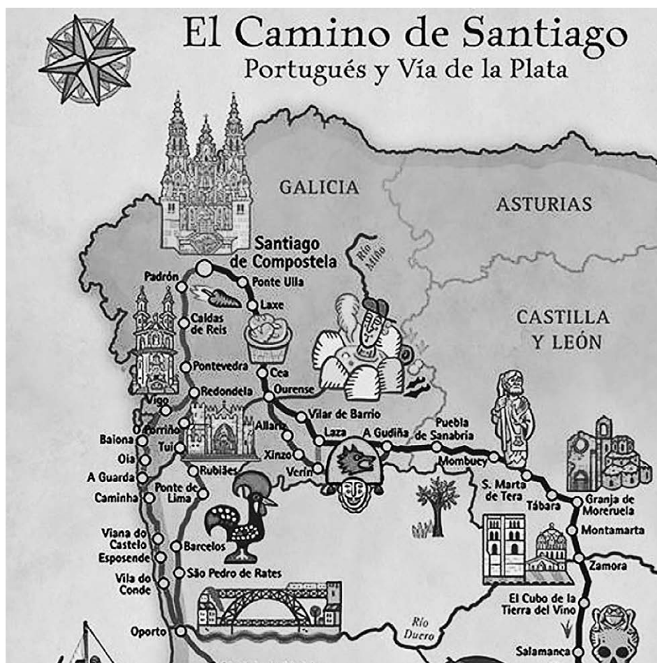
Карта пилигримов. Португальский путь и Серебряный путь

Дору, небольшие ресторанчики на набережной, практически в каждом из которых играет живая музыка, приветливые улыбающиеся люди, гуляющие вдоль реки... Все это создавало прекрасное настроение, и лишь легкое волнение, вполне естественное перед дальней дорогой, все еще оставалось со мной.