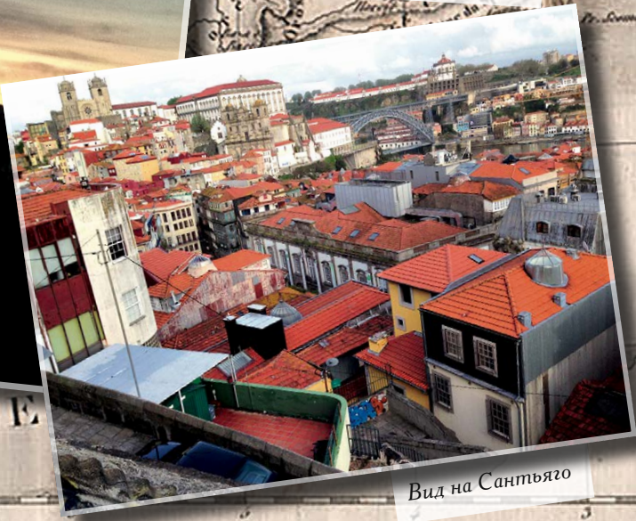
Вид на Сантьяго