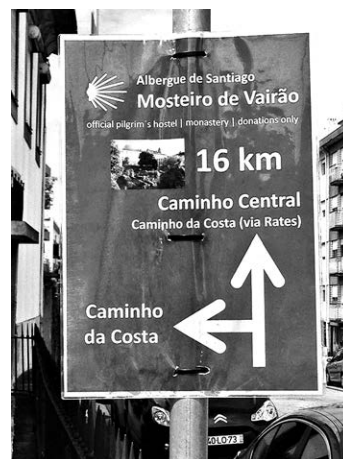
Указатель для пилигримов

Пилигримское сообщество чрезвычайно разнообразно. По паломнической тропе идут люди со всего света, разных профессий, имеющие разный уровень доходов и образования. Но все это не имеет никакого значения. Тропа принимает каждого. В пути мне встретилось много интересных людей. Кто-то рассказывал об архитектуре, характерной для этой местности, кто-то о местных обычаях или местной кухне, кто-то о своей стране и ее традициях, кто-то читал стихи своих любимых поэтов, и все было понятно, даже если стихи эти читали на незнакомом языке. И, конечно, пели песни. Вечерами, когда все отдыхали после дневного, порой нелегкого, пути, частенько откуда-то