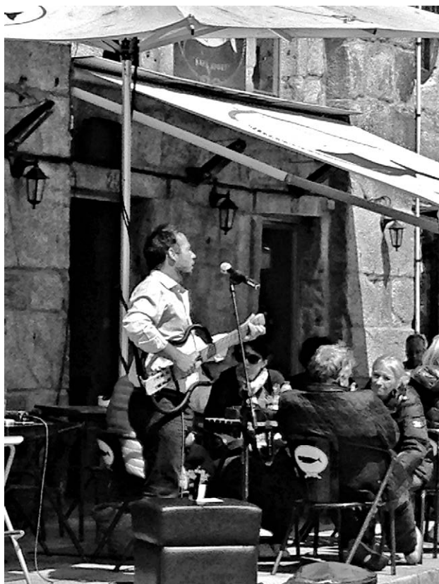
Музыканты и слушатели на площади Обрадойро

после того как я вышла из собора на площадь, случилось несколько встреч. Расставаться не хотелось, мы обсуждали как проведем наш прощальный вечер. В это время в дальнем конце площади ребята похожие на хиппи стали петь под гитару. Недалеко от них появилась та самая девушка с черной фетровой шляпой и тоже запела. Образовалось два круга слушателей, которые начали подпевать, через некоторое время обе группы стали как бы соревноваться друг с другом. Сначала «хиппи» спюют песню вместе со своими слушателями, потом вступает наша певунья со своими фанатами. Людей становилось все больше и вот уже обе группы поющих слились в одну и стали петь песни, которые знали все. Конечно же это были песни Битлз, Аббы и Элвиса Пресли, а также любимая всеми «Besame mucho» и многие другие популярные по всему миру песни. А потом кто-то запел «Hallelujah» Леонарда Коэна. Куплет следовал за куплетом, запевали разные люди. Песня длинная, куплетов много, а припев «Hallelujah» пела вся площадь. Песня неслась над площадью, над собором, над городом, голоса сливались в единый мощный хор. Как сейчас вижу площадь Обрадойро, освещенную солнцем и счастливые одухотворенные лица людей, объединенных паломничеством, удивительным городом и этой прекрасной песней. Для меня это символ того, что мы, люди Земли, хотим и можем жить в мире и в ладу друг с другом, в каком бы месте нашей планеты ни находился наш дом. Человечеству есть к чему стремиться.