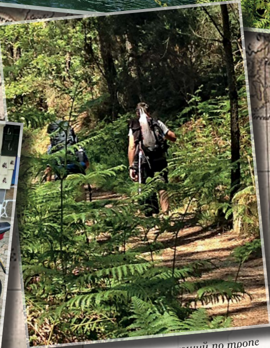
Пилигрим, шагающий по тропе