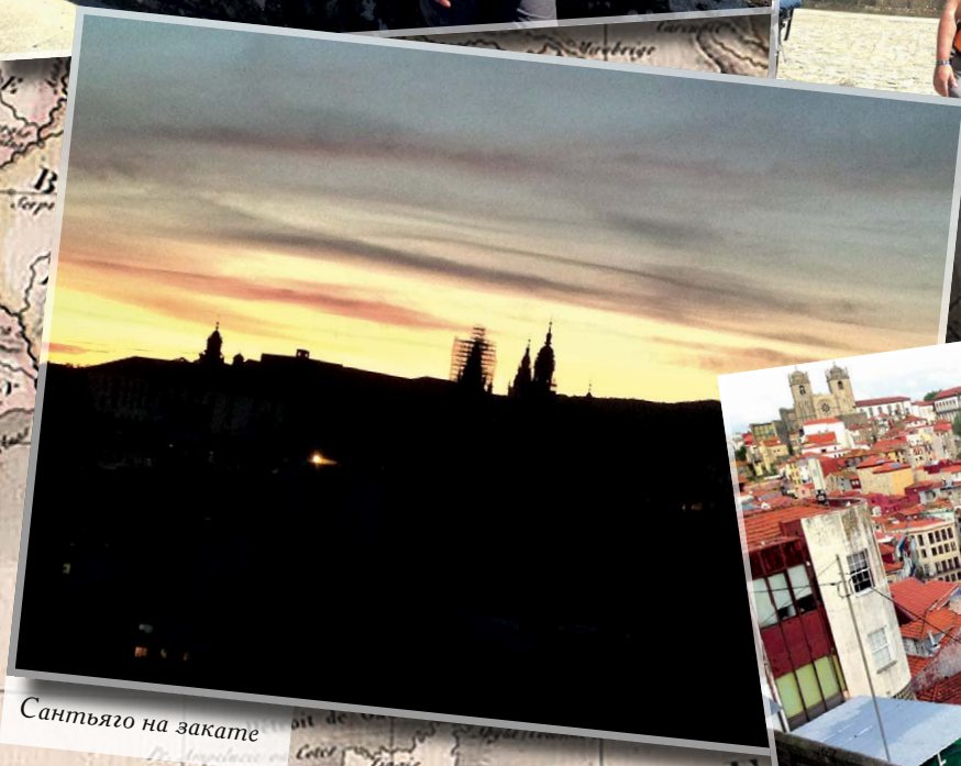
Сантьяго на закате