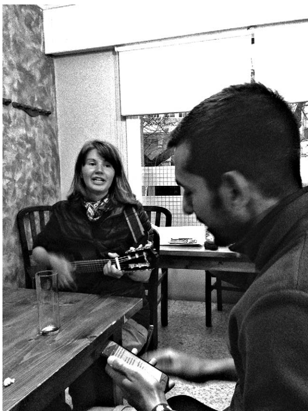
Вечерние посиделки пилигримов

появлялась гитара, и песни звучали под ее аккомпанемент. Это был какой-то стихийно возникающий фестиваль песен стран народов мира и каждый исполнитель радовался, когда его песню подхватывали. Несколько раз я встречалась с девушкой, которая путешествовала, зарабатывая своим пением. Она пела, а кто-нибудь по ее просьбе собирал пожертвования в большую широкополую черную фетровую шляпу. Себе она брала, по ее словам, денег на 2-3 дня, а на остальное, если оставалось, угощала желающих сыром и вином. Однажды и мне довелось походить с ее шляпой. Зрители подпевали, щедро наполняли шляпу мелочью, и денег набралось изрядное количество. На вино и сыр собралась большая веселая компания и мы провели прекрасный вечер, то продолжая петь, то беседуя о том о сем.