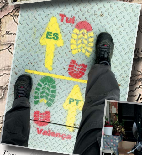
Граница между Испанией и Португалией