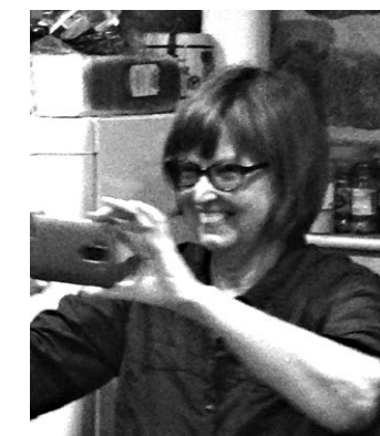
Сверху вниз: Пилигримы из Бразилии, Словении, США