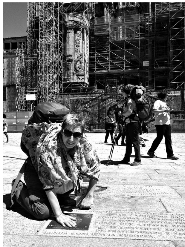
Автор статьи у ракушки — символа окончания пути

Весь мой следующий день был посвящен собору. Эмоции захлестывали. Паломническая служба